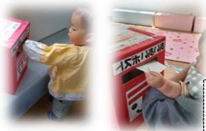
お手紙を書いたよ 手形をとって、かわい いお花の完成♡