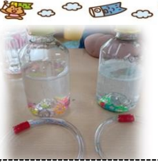
手作りおもちゃをつ つたよ! 完成したらさ っそく遊んでいたよ(0)