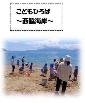
こどもひろば ～西脇海岸～