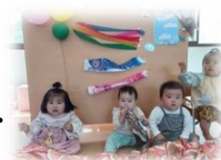
こどもの日お祝い会 こいのぼりトンネルに通ったりしたよ!